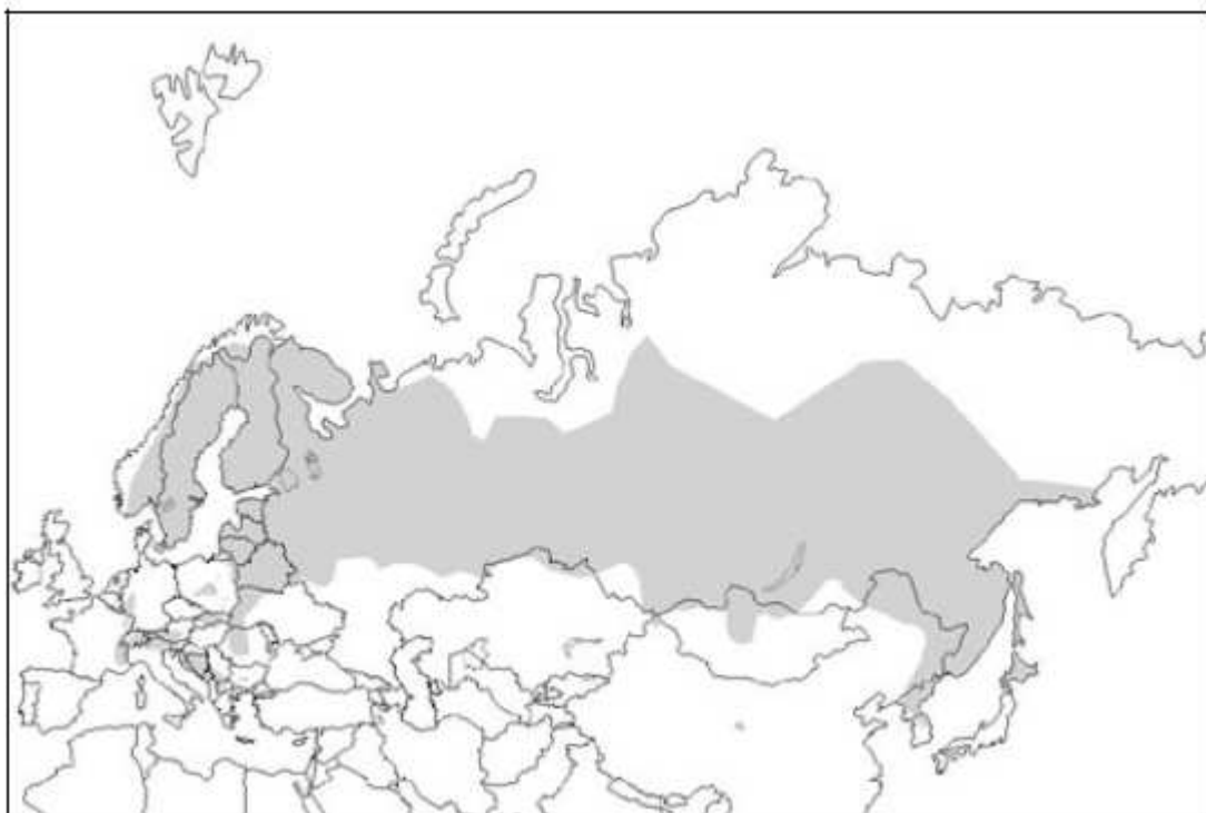
Figure 1 : Distribution mondiale de la gélinotte des bois ( Bonasa bonasia ) (extrait de Storch (comp. & ed.) 2007)

La zone potentielle de distribution de la gélinotte comprend généralement les plaines tempérées et froides à basse altitude de la région Paléarctique (figure 1). Dans le continent européen, la dégradation des habitats dus à l'occupation humaine a conduit au fait que cette espèce se rencontre pratiquement que sur des territoires de montagne (Cramp & Simmons 1980 ; Yeatman-Berthelot 1991). Autrefois, dans ce continent, elle s'étendait sur des zones forestières à basse altitude ; actuellement les populations les plus nombreuses et stables, et qui sont en légère augmentation, se situent dans les principaux massifs montagneux, spécialement dans les Alpes (Bernard-Laurent & Magnani 1994).