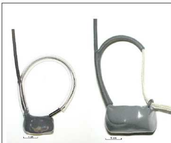
Figure 5 : Exemple d'émetteurs type collier

Les émetteurs utilisés seraient type collier (figure 5) et pèserait moins de 20 g. Le suivi s'effectuerait entre 2 et 3 fois par semaine avec un personnel qualifié, faisant un contrôle de localisation de tous les individus libérés.