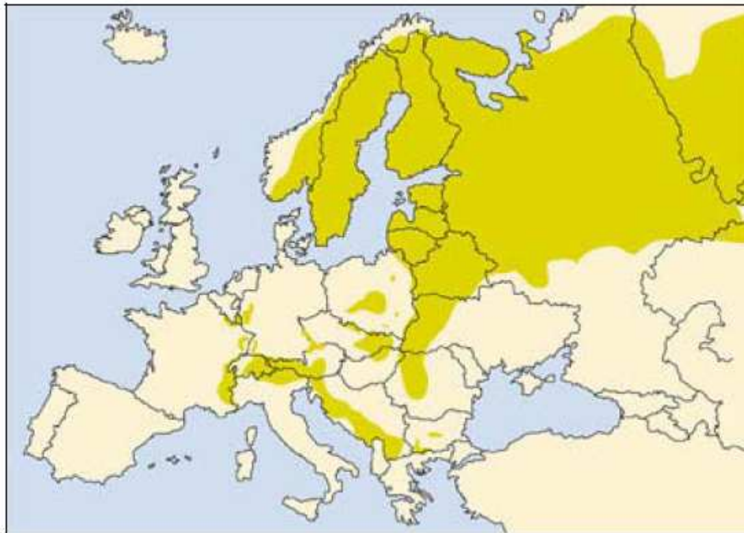
Figure 2 : Distribution de la gélinotte des bois en Europe. Pas de représentation des populations reliques des Pyrénées et du Massif Central (extrait de Storch (comp. & ed.) 2007)

mètres (Yeatman-Berthelot 1991), ainsi même dans les Alpes suisses on a trouvé des indices de nidification à 2160 mètres d'altitude (Schmid et al. 1998). Bien que s'agissant du tétraonidé le plus thermophile, il est absent des régions situées au-dessus de l'isotherme de juillet de 21°C (Yeatman-Berthelot & Jarry 1995). L'ensemble de la population française, suisse et italienne, la majeure partie dans les Alpes, s'estime autour des 27.000-31.000 individus (Storch (comp. & ed.) 2007). Les populations les plus proches des Pyrénées se situent dans les Préalpes occidentales (région Rhône-Alpes) et une petite population au nord-est dans le Massif Central (fruit de réintroduction).