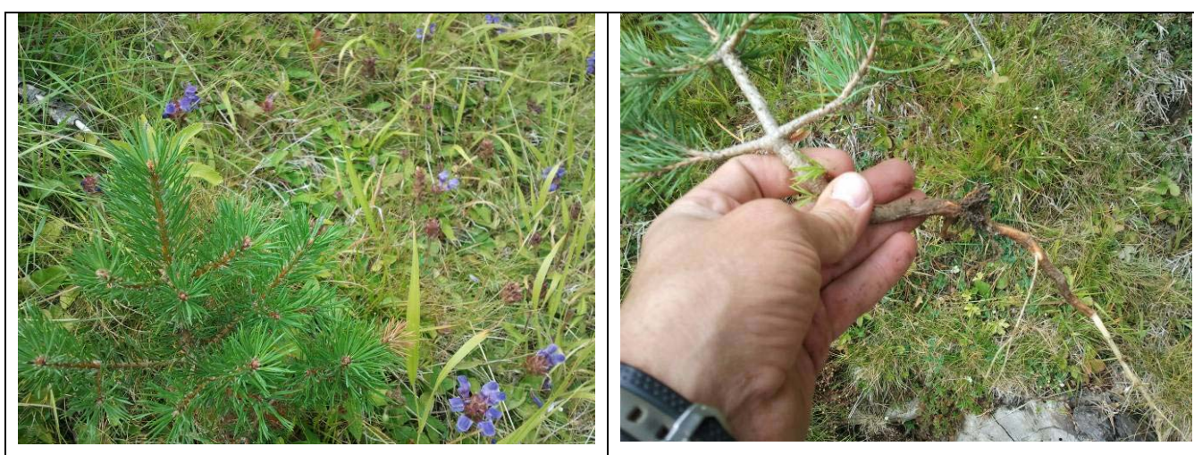
Figura 2. A la izquierda ejemplar joven de pino instalado en la parcela. a la derecha arranque del mismo de forma manual

Se pretende actuar antes de que la regeneración alcance una extensión, tamaño y enraizamiento demasiado potente para poder ser realizada sin ayuda de maquinaria.